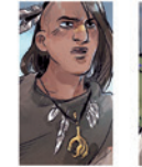
Fig. 2 : Diverses perles et bijoux réalisés en os, dents et coquilles. Musée de la Préhistoire, page 14.

L'ivoire de mammouth servait à la fabrication d'outils, de parures, de statuettes, etc. ainsi que les instruments de musique.